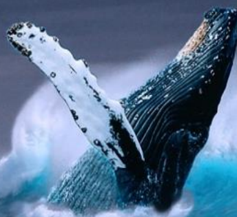
Ballena yubarta o Jorobada ( Megaptera novaeangliae )